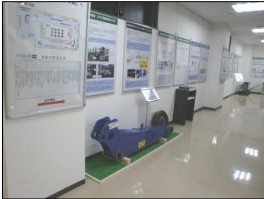
②事故に学ぶ館内部