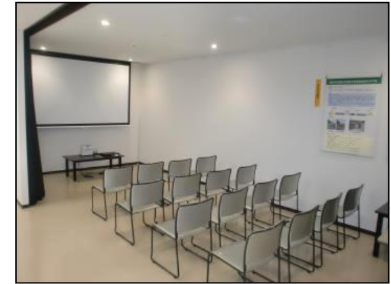
④ビデオ活用の学習室