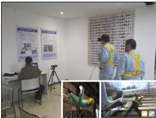
③VR(バーチャルリアリティ)コーナー