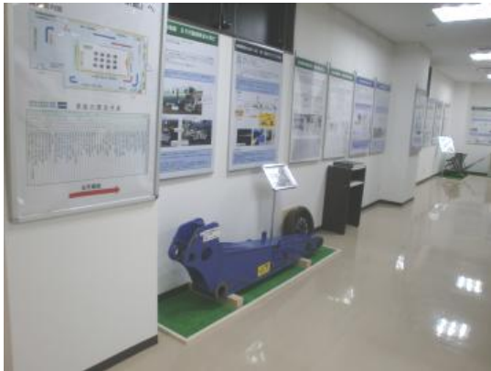
②事故に学ぶ館内部